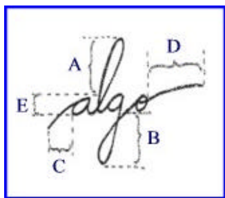
En la Palabra